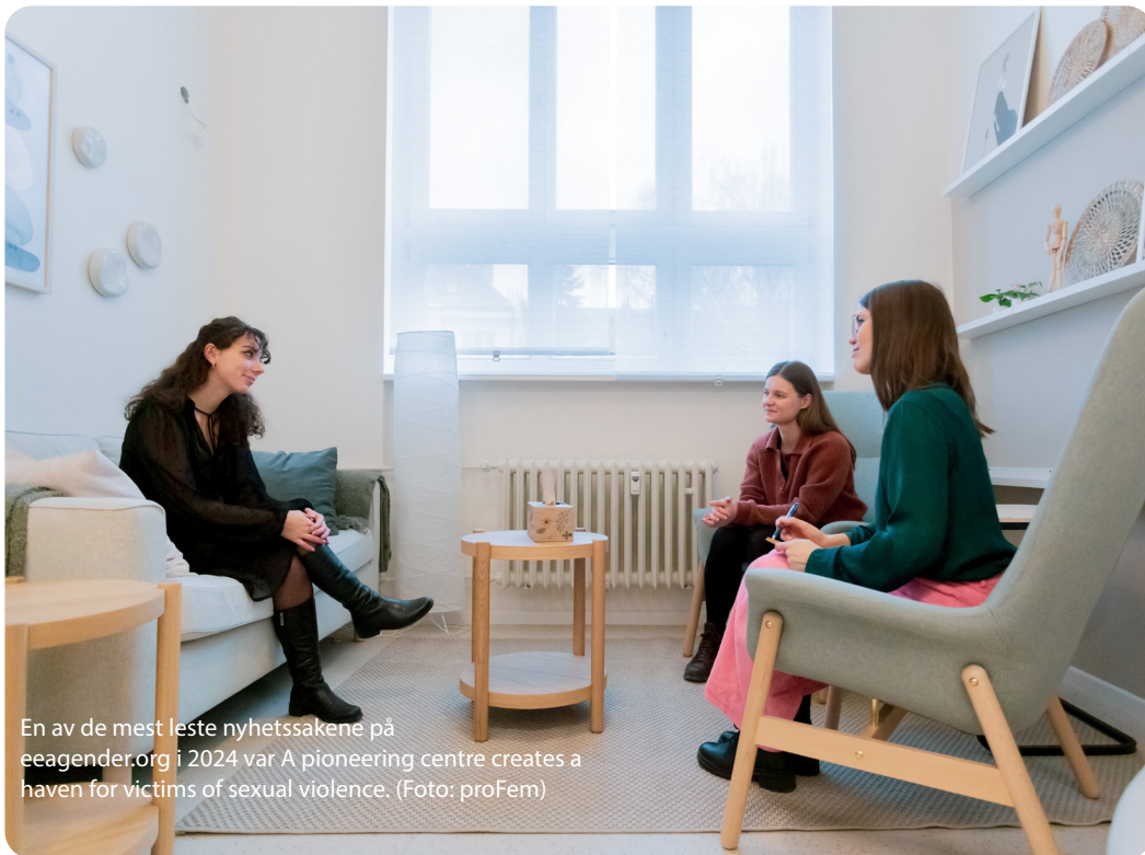
En av de mest leste nyhetssakene på eeagender.org i 2024 var A pioneering centre creates a haven for victims of sexual violence.

På nettstedet delte vi også andre nyheter som er relevante for nettverket, som kurs og andre arrangementer, og ressursmaterieell som rapporter, veiledere og nyttige ressurser. Vi republiserer også nyhetsartikler om forskning på vold i nære relasjoner og kjønnsbasert vold fra samarbeidspartnere.